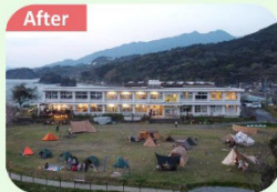
宿泊施設、サービス・物販施設等